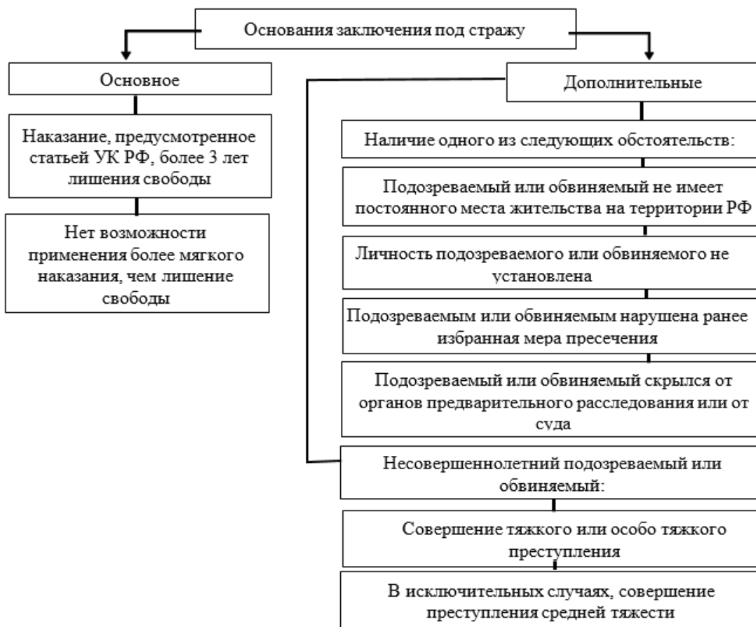
Рис. 2. Основания заключения под стражу

Также необходимо отметить, что в срок содержания под стражей включаются: время задержания лица в качестве подозреваемого, время нахождения под домашним арестом, время принудительного нахождения в медицинской организации по решению суда, время содержания под стражей на территории иностранного государства.