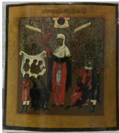
Рис. 4. Общий вид лицевой стороны иконы после реставрации