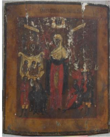
Рис. 1. Общий вид лицевой стороны иконы до и после реставрации