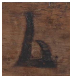
Рис. 3. Надпись на обороте клеймо мастера старославянской письменности