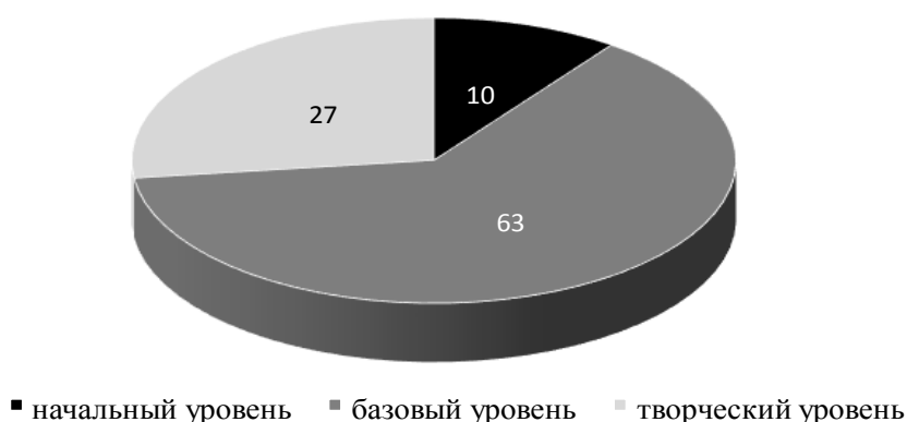
Рисунок 2. Распределения педагогов по уровням профессиональной мобильности в % (N=30)

По мнению экспертов, в образовательном учреждении для педагогов свойственна принадлежность ко всем уровням профессиональной мобильности, однако имеются расхождения в их процентном соотношении ( рисунок 2 ).