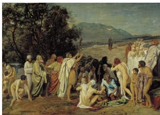
Рис. 4. Александр Андреевич Иванов. «Явление Христа народу» [5]

Мировую известность русскому художнику Александру Андреевичу Иванову (1806–1858) принесла картина «Явление Христа народу» (рис.4). Интересным фактом является то, что данному произведению художник посвятил 25 лет жизни (1837–1857).