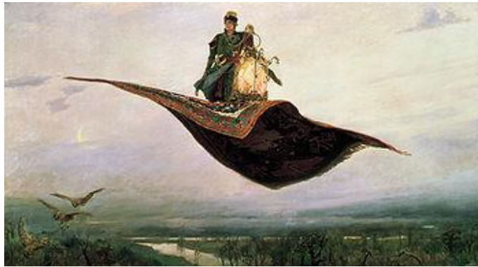
Рис. 2. Виктор Михайлович Васнецов. «Ковер-самолет» [5]

Знакомство с историческими и русскими народными сказочными сюжетами, невозможно представить без картин Виктора Михайловича Васнецова (1848–1926). Он автор картин «Богатыри», «Аленушка», «Три царевны подземного царства», «Ковер-самолет» (рис. 2) и др. Васнецов выполнил росписи в Историческом музее в Москве и во Владимирском соборе в Киеве [1].