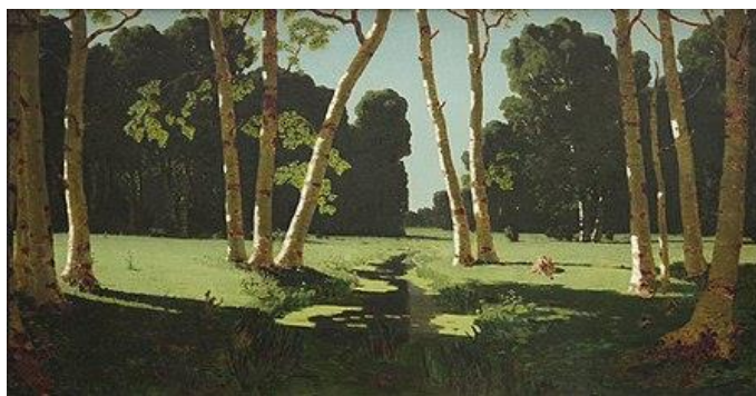
Рис. 5. Архип Иванович Куинджи. «Березовая роща» [5]

А выдающийся русский художник и талантливый педагог Архип Иванович Куинджи (1842–1910) любил изображать мимолетные состояния природы «После грозы», «Днепр утром», «Лунная ночь на Днепре». Его картина «Березовая роща» (рис. 5) просто пронизана чистотой и прозрачностью воздуха и света.