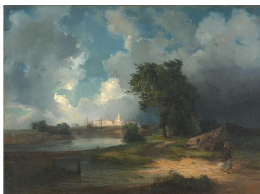
Рис. 1. Алексей Кондратьевич Саврасов.

Алексей Кондратьевич Саврасов (1830–1897) был не просто выдающимся русским художником. Он был мастером лирического пейзажа. Саврасов создал такие полотна, как «Рожь», «Проселок» и др. А картина «Грачи прилетели» (1871) прославила имя художника. В Третьяковской картинной галерее находится картина «Вид на Кремль в ненастную погоду» (рис.1). Необычно представлен вид на Кремль. Здесь главным «действующим лицом» является русская природа, такая разная и прекрасная во всех своих проявлениях.