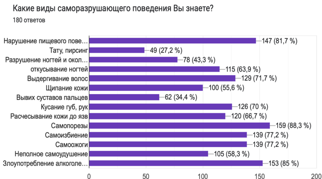
Рис 1. Ответ на вопрос Какие виды саморазрушающего поведения вы знаете?

Самым «популярным» способом самотравмирующего поведения в студенческой среде являются самопорезы, нарушение пищевого поведения и злоупотребление алкоголем.