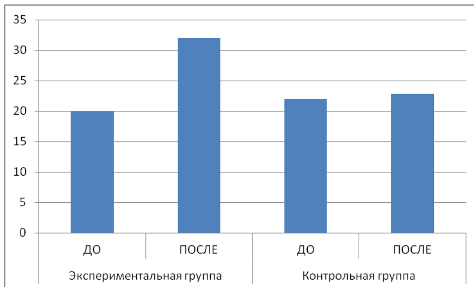
Рис. 1. Усреднённые сдвиги в экспериментальной и контрольной группах ДО и ПОСЛЕ эксперимента по уровню субъективного благополучия

Статистическая значимость этих сдвигов в экспериментальной группе была подтверждена с помощью углового преобразования Фишера (2,44 при p \leq 0,01 ), в то время как в контрольной группе сдвиг статистически незначим (1,01).