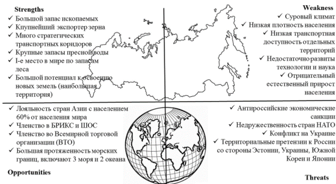
Рис. 2. Матрица SWOT-анализа для планирования мероприятий по управлению экономическим развитием

Этап второй. Анализ сильных и слабых сторон социально-экономических отношений внутри страны во всех сферах деятельности, а также угроз и возможностей со стороны иностранных контрагентов – SWOT-анализ (рисунок 2).