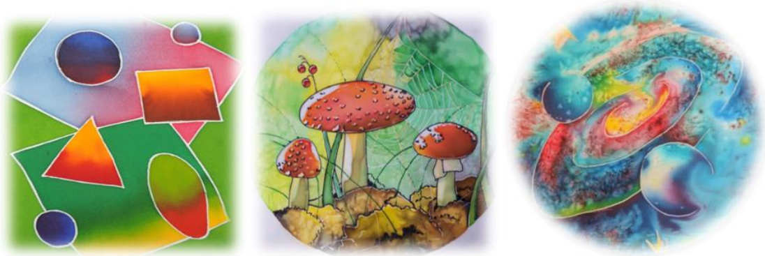
Рис. 1. Холодный батик

ресна солевая техника, когда на окрашенную ткань посыпают крупы соли, соль вбирает в себя краситель, в результате чего появляются интересные узоры.