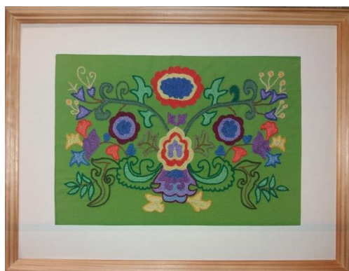
Рис. 4. Вышивка

Совместное занятие вышивкой начинается с умения держать иглу, прокалывать ткань, делать стежки «вперед иголку», с возрастом усложняя их до стежков якобинской вышивки: французский узелок, рококо, различные сетки, паутинки и др. Вышивка бисером, пайетками, создание на основе этих вышивок небольших изделий – творческий процесс, способствующий художественно-эстетическому воспитанию детей.