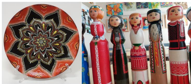
Рис. 3. Точечная роспись

А с самыми маленькими – взять обычный фломастер и наносить линии по предварительно вырезанной по фигуре бумаге.