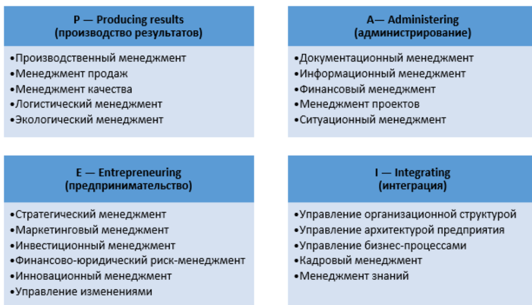
Рис. 2. РАЕІ-классификация направлений менеджмента [1]

Существуют различные подходы к типологии менеджмента. Наиболее интересной представляется РАЕІ-классификация, разработанная Ицхаком Адизесом (рис. 2).