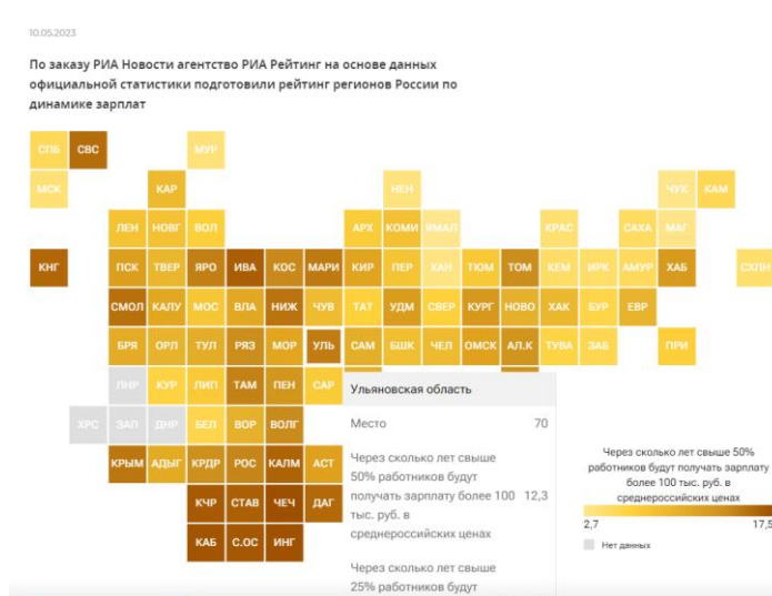
Рис. 3. Рейтинг регионов по зарплатам [4]

Исследование взаимоотношений труда и капитала показало, что данные явления взаимосвязаны друг с другом. Состояние одного влияет на показатель другого. Существуют положительные и отрицательные стороны взаимодействия капитала и труда. Среди положительных сторон можно отметить: рост благосостояния, новаторские решения и идеи, новые продукты и услуги, более совершенные технологии и механизмы, влияние на темпы прироста ВВП, ВРП, увеличение конкурентоспособности, как самих владельцев капитала (частные коммерческие предприятия, организации), так и в макроэкономическом понимании всей экономической системы. Неэффективное взаимодействие исследуемых категорий, когда не соблюдаются интересы сторон, как владельцев рабочей силы, так и владельцев капитала, могут привести к негативным последствиям, таким, как: безработица, экономический спад, девиантное поведение неза занятого активного трудоспособного населения, расслоение социальных групп, психические расстройства как потерявшего работу человека, так и общества в целом, если такое отрицательное взаимодействие затрагивает широкие массы и другое. Состояние макроэкономической нестабильности не выгодно государству и обществу, так как это влияет не только на деятельность частных субъектов экономических отношений, но и на макроэкономические показатели в целом, на рост благосостояния населения. В связи с этим вмешательство государства необходимо с целью приведения показателей экономической модели в от-