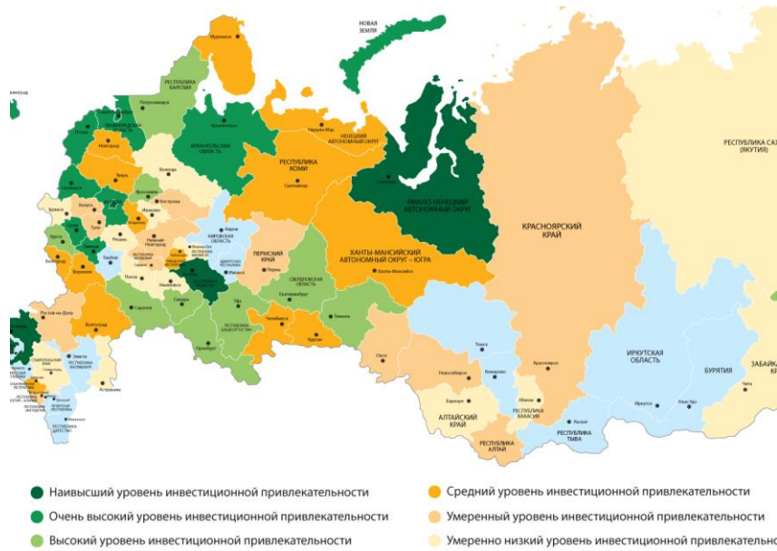
Рис. 1. Рейтинг инвестиционной активности (2022 г.) [4]

ный округ, Республика Татарстан (рис. 1). Ульяновская область имеет умеренно низкий уровень инвестиционной привлекательности.