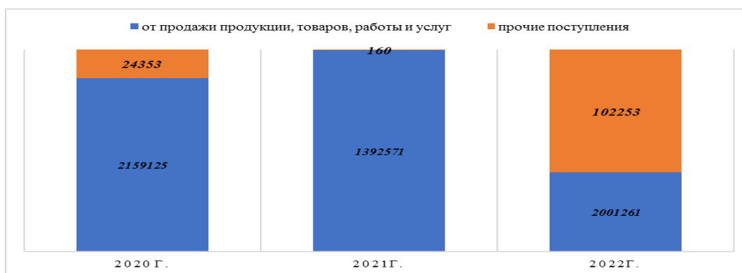
Рис. 2. Динамика поступления денежных средств от текущих операций, тыс. руб.

При этом превышение поступлений над выплатами как по предприятию в целом, так и по видам деятельности означает приток средств, а превышение выплат над поступлениями – их отток [12, с. 59].