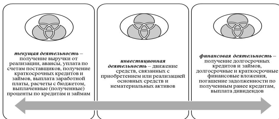
Рис. 1. Виды деятельности организации, связанные с движением денежных средств

В России прямой метод положен в основу формы «Отчета о движении денежных средств» [7, с. 300].