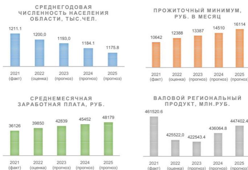
Рис 1. Ключевые показатели социально-экономического развития Ульяновской области

Рассмотрим ключевые показатели социально-экономического развития Ульяновской области (рис. 1).