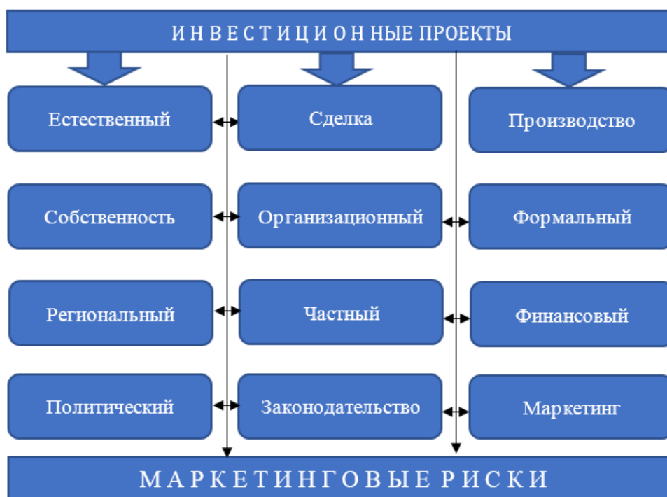
Рис. 1. Основа риска реализации инвестиционного проекта