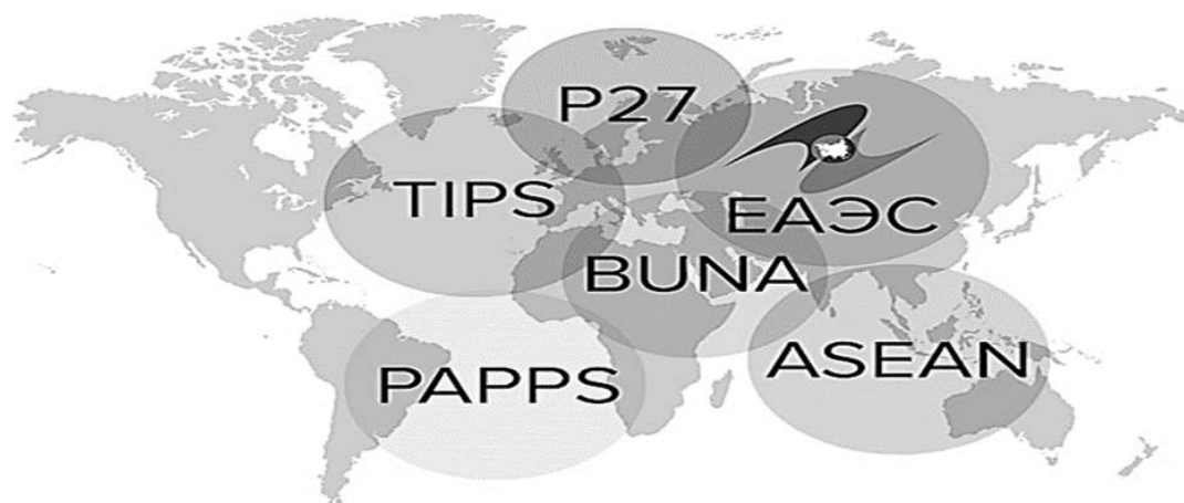
Рис. 1. Региональные платёжные платформы [1]

встроенность национальных платёжных систем в мировую финансовую инфраструктуру.