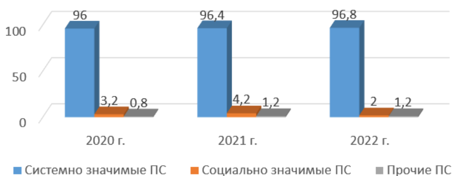
Рис. 3. Структура переводов денежных средств, осуществляемых в рамках значимости платёжных систем, (%) [4]

И ещё необходимо отметить параметры значимости платёжных систем. Одним из них является социальная значимость, определяемая не только показателями Банка, но и отношением граждан. В характеристику направлений социальной значимости (см. Закон о НПС) включены объёмы переводов без открытия банковского счёта, осуществление перевода с помощью платёжных карт платёжной системы и др. По показателям, приведённым на рисунке 3 можно сделать выводы о том, что население при выборе платёжной системы пока предпочитает организации, которые уже имеют определённый вес на рынке финансовых услуг, и те, которые так или иначе контролируются государством.