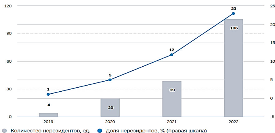
Рис. 2. Динамика количества участников российской Системы передачи финансовых сообщений (СПФС), 2019–2022 гг.

Трансграничные переводы также продолжают осуществляться, обеспечивая внешнеэкономическую деятельность российских компаний. Однако международные платёжные системы обладают рядом недостатков: санкционный прессинг, высокая стоимость услуг (до 10% от суммы перевода), низкая скорость. В связи с этим на уровне G20 в 2020 г. была принята Дорожная карта по повышению эффективности трансграничных платежей. Контроль за её выполнением был возложен на Совет по финансовой стабильности (СФС) и Комитет по платежам и рыночным инфраструктурам при Банке международных расчетов (КПРИ БМР). Были определены стандарты формирования обновлённой системы трансграничных платежей. В частности, предполагается использовать ISO 15022 и ISO 20022, снизить стоимость переводов до 1%, определить скорость перевода до 1 часа в не менее, чем 75% переводов, иметь возможность осуществлять переводы не только через банковские платёжные системы. По исследованиям Банка международных расчетов, 20% регуляторов могут запустить в обращение розничные цифровые валюты центральных банков до 2026 г. [1].