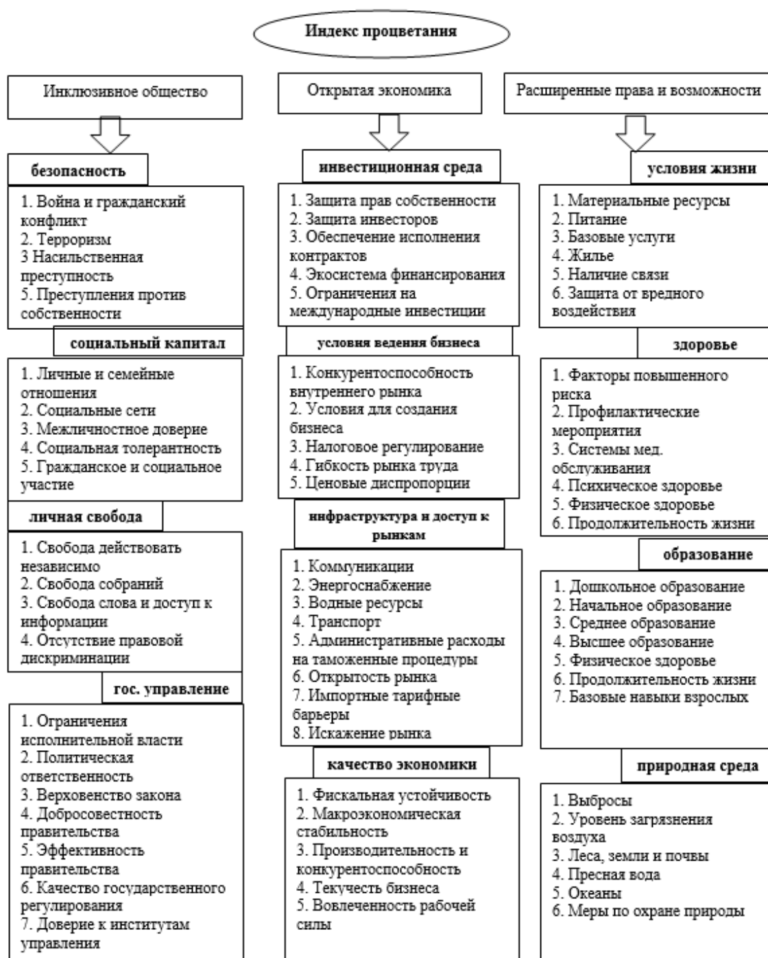
Рис. 1. Области, сферы и индикаторы для расчета индекса процветания

Чем выше рейтинг, тем выше показатели данной страны по данному столпу или элементу, по сравнению со страной, находящейся ниже в рейтинге.