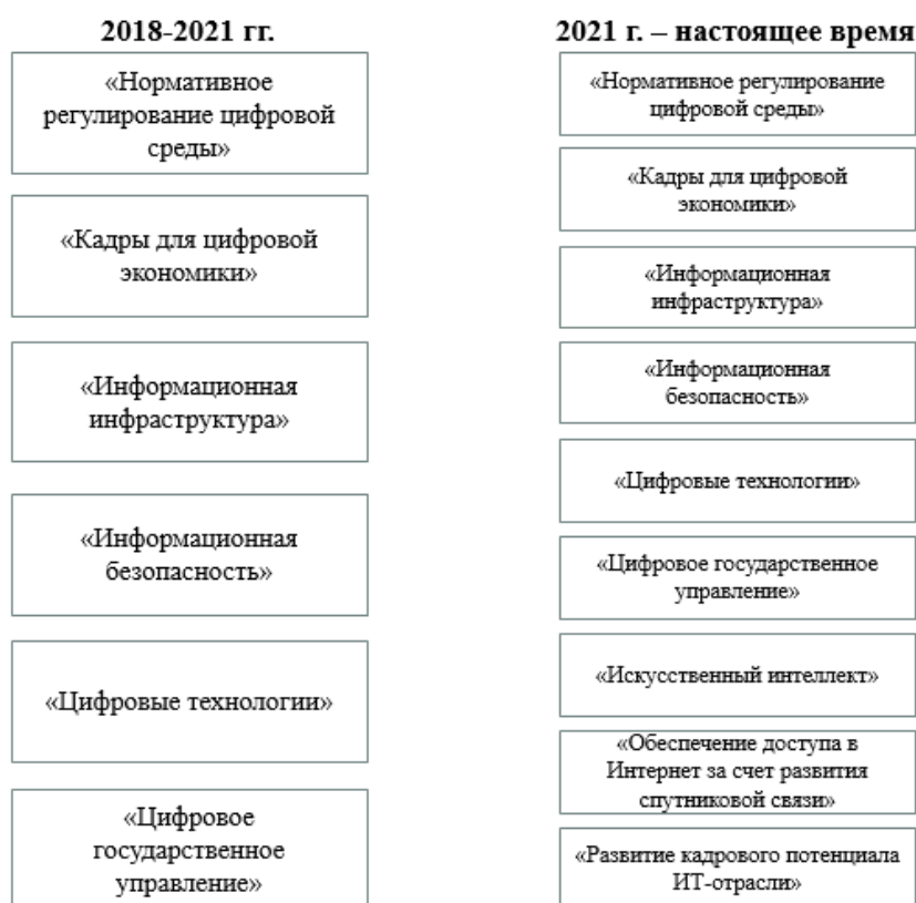
Рис. 2. Состав федеральных проектов в рамках нацпроекта «Цифровая экономика» (сост. авт.)

новых и экологически чистых технологий может снизить негативное воздействие на окружающую среду и обеспечить стабильное энергетическое будущее страны.