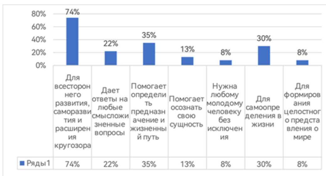
Рис. 2. Распределение ответов курсантов на вопрос: «Для чего вам нужна философия?»

есть и для чего он нужен, взять ориентир для себя и своего жизненного пути», «в свете ВС дисциплина необходима, чтобы выполнять поставленные задачи без сомнений», «чтобы уметь не по шаблону думать и действовать, учиться размышлять и думать самому», «дает ответы на многие вопросы», «расширяет границы мышления», «помогает адекватно оценить обстановку, а главное относиться к этому соответственно», «знакомит с историей человечества», «прививает тягу к прекрасному», «учит думать, выстраивать и излагать свои мысли правильно», «помогает рассматривать события в комплексе и с разных сторон», «помогает в преобразовании собственного мировоззрения», «служит фундаментом для последующего обучения курсантов».