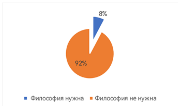
Рис. 1. Распределение ответов курсантов на вопрос: «Нужна ли вам философия?»

Респонденты письменно ответили в произвольной форме на два вопроса: нужна ли философия курсанту, если да, то зачем?