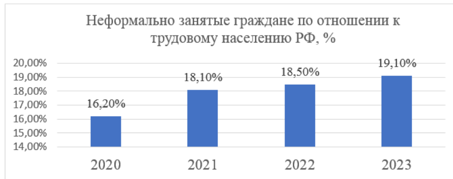
Рис. 2. Неформально занятые граждане по отношению к трудовому населению РФ [2]

мом деле их гораздо больше. Из этого следуют проблемы роста теневой занятости и, в последствии, увеличение объема теневой экономики, за счет осуществляемой блогерами деятельности, не закрепленной никакими нормативно-правовыми актами, что является угрозой экономической безопасности страны (рисунок 2).