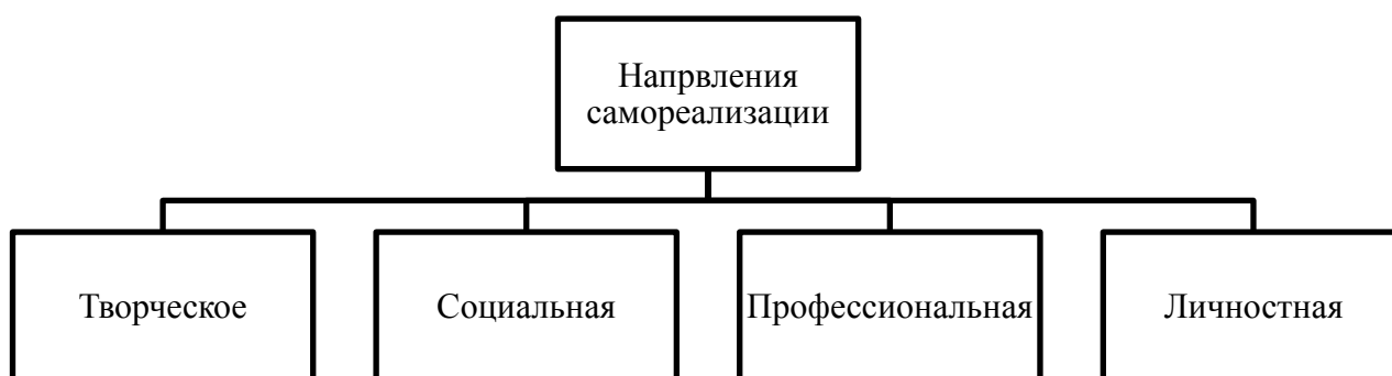
Рис. 3. Направления самореализации личности юношеского возраста.

Следует понимать, что юность очень богата возможностями для раскрытия личности. Самореализация может проявляться в нескольких направлениях, они указаны на рисунке 3.