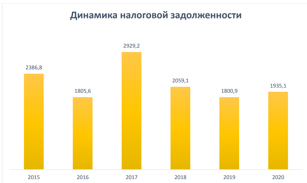
Рис. 1. Динамика объема налоговой задолженности в России в период 2015–2020 гг., в млрд руб. [1]

В подтверждении актуальности проблематики необходимости урегулирования и взыскания налоговой задолженности в российской практике являются данные, отображающие динамику изменения ее объема (рис. 1). В 2020 г. объем налоговой задолженности налогоплательщиков России перед ФНС составляли 1,935 трлн руб., что на 134,2 млрд руб. больше, чем в 2019 г.