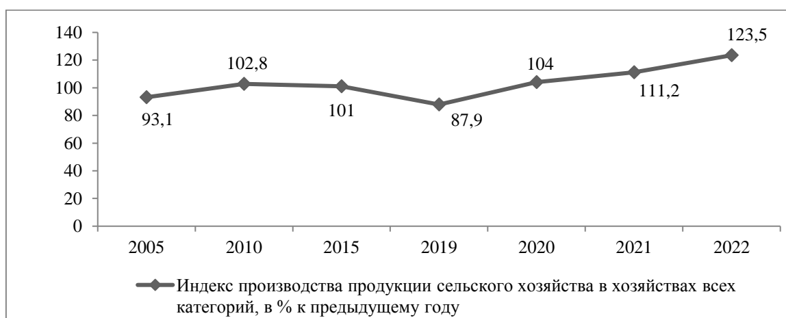
Рис. 3. Индекс производства продукции сельского хозяйства Амурской области

Важной составной частью региональной экономики является сельское хозяйство, развитие которого может быть охарактеризовано с помощью индекса производства продукции сельского хозяйства. Среди субъектов ДФО Амурская область (наряду с Приморским краем) лидирует и по данному показателю. В 2022 г. его значение составило 123,5%, увеличившись с 2021 г. на 12,3% (рис. 3).