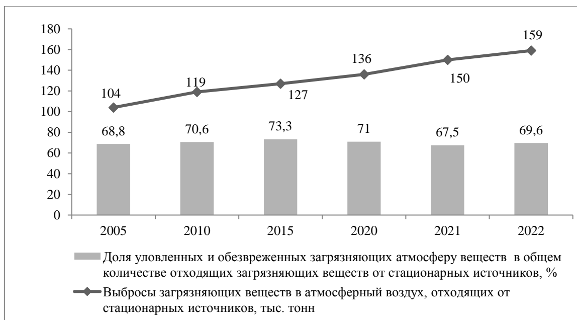
Рис. 5. Показатели экологической безопасности Амурской области

Экологическое развитие предпринимательской среды может быть охарактеризовано с помощью показателей экологической безопасности. Как видно на рис. 5, в период с 2005 г. по 2022 г. наблюдается систематическое увеличение объема выбросов загрязняющих веществ в атмосферу. В то же время отмечается снижение доли уловленных и обезвреженных загрязняющих атмосферу веществ в период с 2015 г по 2021 г.