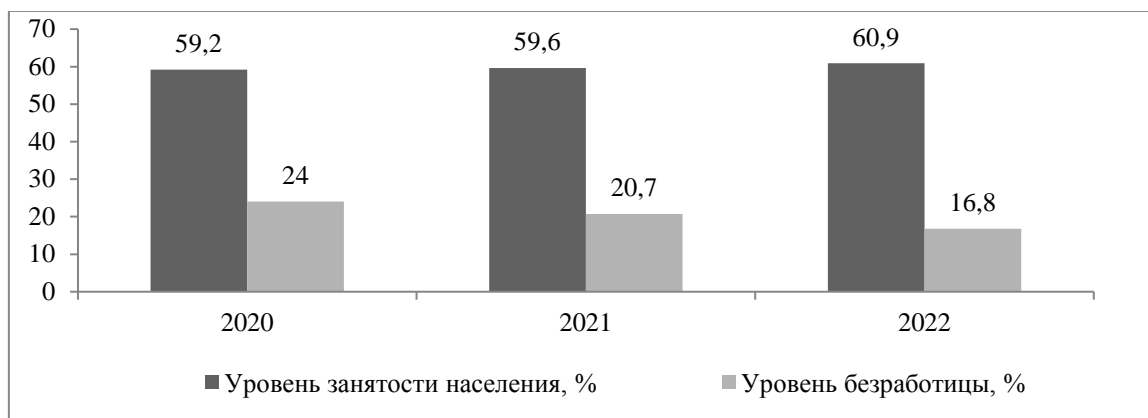
Рис. 4. Уровень занятости и безработицы Амурской области в 2020–2022 гг.