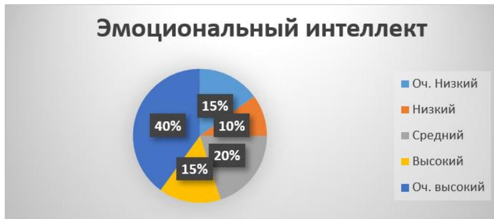
Рис. 2. Показатели уровня эмоционального интеллекта по тесту «ЭмИн» Д.В. Люсина

Для ответа на вопрос о взаимосвязи возможности старших подростков понимать эмоции и управлять ими, используя интроспективные способности, мы провели корреляционное исследование между уровнем эмоционального интеллекта и уровнем интроспекции при помощи коэффициента ранговой корреляции Спирмена. Наше исследование выявило прямую взаимосвязь ( r = 0,61 ; p < 0,001 ) между уровнем эмоционального интеллекта и уровнем интроспекции у старших подростков, что подтверждает выдвинутую гипотезу. При этом очерчивается важная практическая задача – выяснить личностные и социально-психологические особенности подростков с низкими показателями по обоим тестам. Вероятно, для тренировки эмоционального интеллекта и интроспекции у старших подростков необходимо уделять внимание практическому развитию способности к самоанализу, организации обсуждения личного опыта эмоционально окрашенных отношений в групповом формате. Такие занятия помогут им лучше понимать себя и свои эмоции, что важно для успешной адаптации в социальной среде.