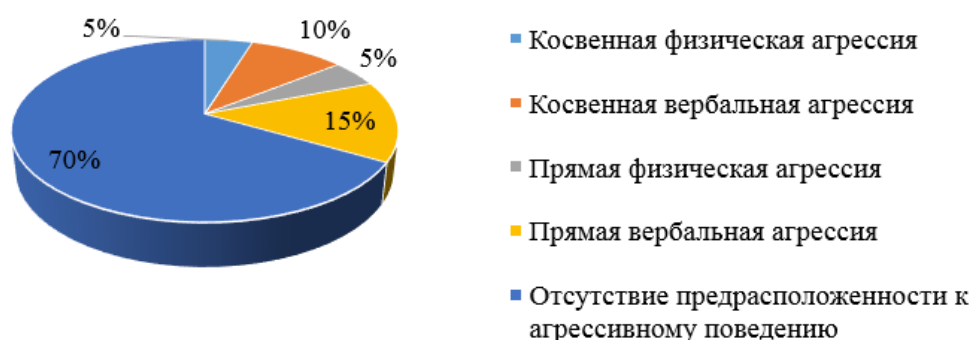
Рис. 2. Результаты обследования агрессивности подростков, полученные после коррекционной работы

После проведения психокоррекционной работы, было проведено повторное обследование подгруппы подростков, имеющих склонность к агрессии. Полученные данные представлены на диаграмме (рисунок 2).