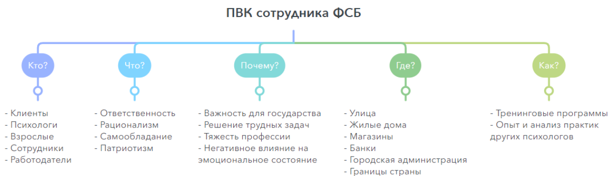
Рис. 1. Аффинная диаграмма профессионально важных качеств сотрудника ФСБ

Из рисунка 1 видно: в проблемном поле практики находятся психологи, клиенты – сотрудники ФСБ и их работодатели. Данная область психологических исследований обладает важностью для государства, направлена на решение профессионально важных задач, связанных с психоэмоциональным состоянием сотрудников рассматриваемой сферы деятельности. При этом ситуация может разворачивается во всех социальных пространствах, где может находиться клиент – домашняя обстановка, работа, объекты социальной сферы и т. д. Понимание и решение проблемы может быть достигнуто за счет опыта и анализа практик других психологов, создания и развития проекта психологической практики, направленной на развитие ПВК сотрудника ФСБ.