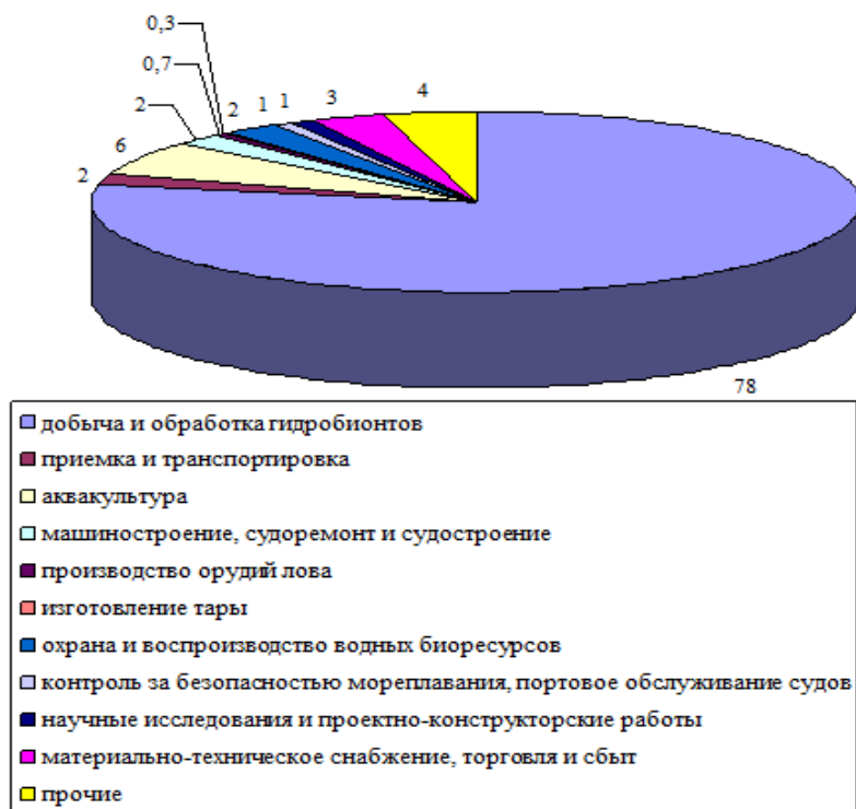
Рис. 1. Структура РКХ России, % [1]

РХК имеет сложную отраслевую структуру, состояние которой в значительной мере влияет на уровень социально-экономического развития страны. Структура РКХ России представлена на рисунке 1.