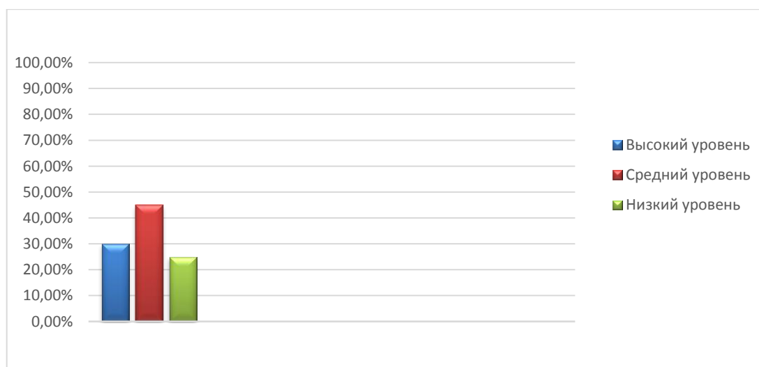
Рис. 2. Результаты диагностики «Закончи историю»

Результаты диагностики «Закончи историю» представлены на рисунке 2.