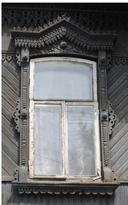
Рис. 2. Окно. Наличник дома. Курганская область

деревообработчиками детали украшений оберегали жилища и их хозяев от всяких «нечистых» сил. Декор на объекте, например, наличник делали по трем зонам: подоконная доска, пилястры, которые идут вдоль самого окна, и надвратная доска или лобная. Каждая из этих деталей имела свой смысл и была, как правило, языческим символом (рис. 2). Так, лобная доска символизировала мир небесный, божий, пилястры и окно – срединный мир реальный, подоконная доска – подземный мир. Пилястры изображали потоки воды, которые идут вниз с неба до самой земли. А в самом центре стены – окно – эта и есть срединная часть конструкции, принадлежащая людям.