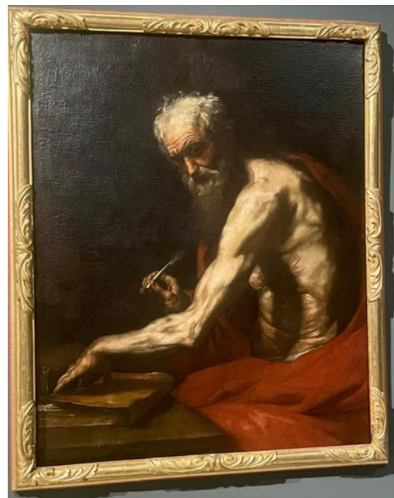
Рис. 2. Рибера Жозе де. Святой Иероним. Музей искусств Мурсии

Кающиеся святые и отшельники (святые Иероним и Мария Магдалина), изображенные в изоляции в тёмных пещерах или кельях со страшными тенями, добровольно ранят и мучают себя, чтобы отвести от искушения и слабости, отвлекающие их от духовного совершенства и божественности. А о неизбежном конце, трагическом и человеческом напоминают сопровождающие их черепа –