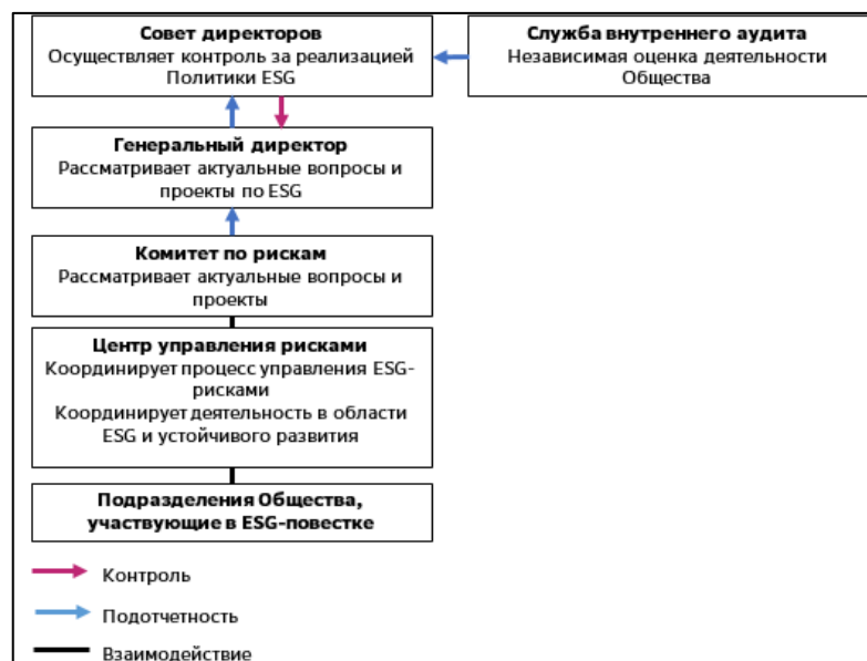
Рис. 2. Место ESG-подразделений в системе управления организации

СберСтрахование, как лидер среди страховых организаций, в соответствии с рекомендациями представил модель организационной структуры, где отражено место подразделений, участвующих в реализации ESG-повестки (рис. 2) [3].