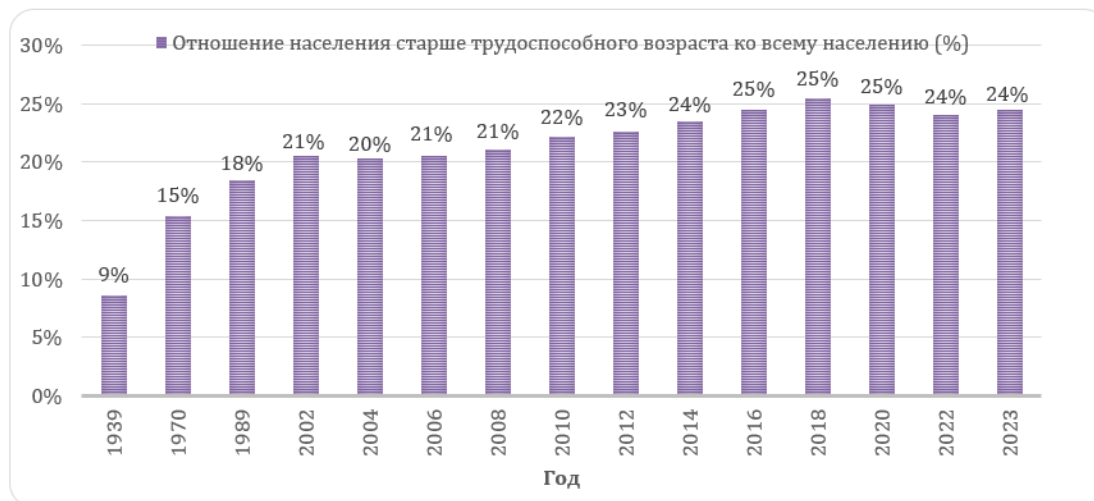
Рис. 1. Доля населения старше трудоспособного возраста в России в 1939–2023 гг.

Старение населения – это явление, при котором количество пенсионеров увеличивается по отношению к остальным возрастным группам населения страны. Рассмотрим данные Росстата об отношении населения старше трудоспособного возраста ко всему населению в процентном соотношении за период 1939 – 2023 гг. (рис. 1) [4].