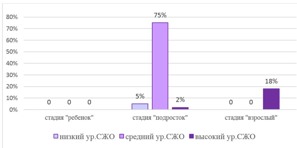
Рис. 3. Соотношение стадии сепарации и уровня смысложизненных ориентаций респондентов, %

Сравнивая результаты, полученные в ходе психодиагностики, можно сделать вывод о наличии взаимосвязи между уровнем СЖО и стадией сепарации молодых людей, что подтверждает основную гипотезу исследования (рис. 3).