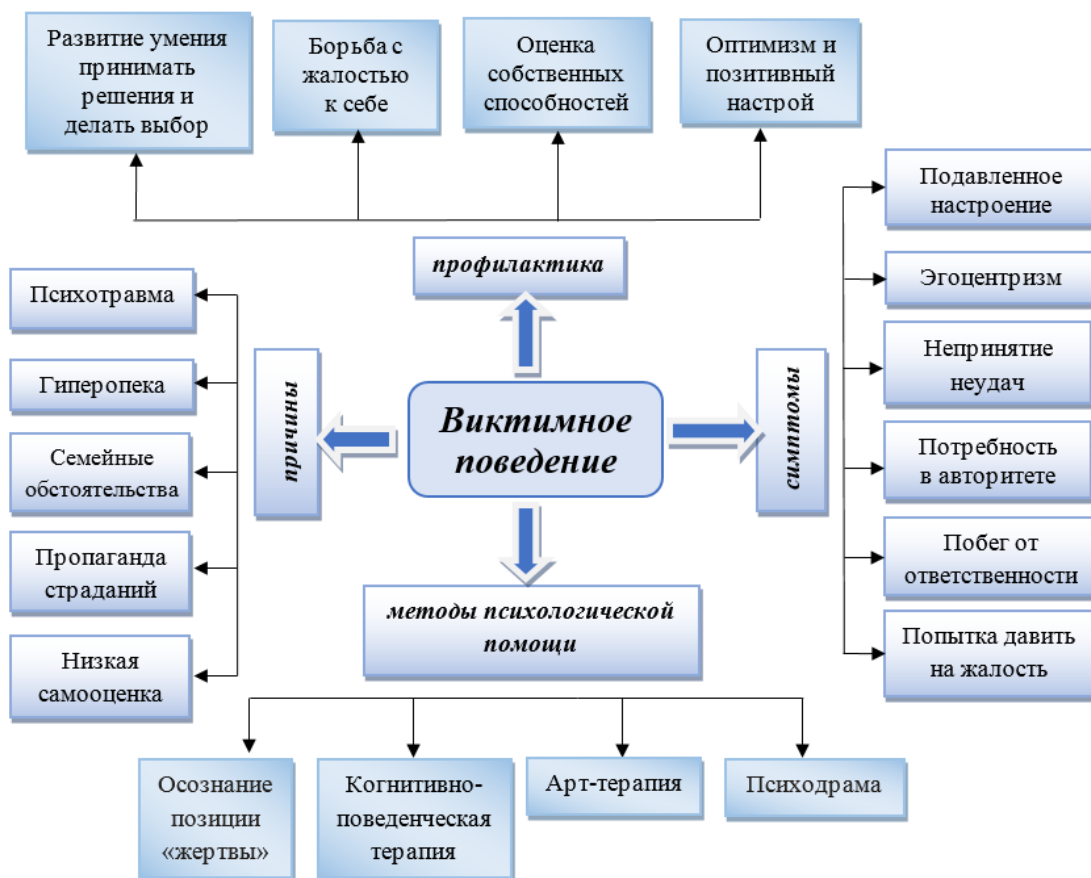
Рис. 1. Интеллект-карта феномена «Виктимное поведение»

Для понимания феномена виктимного поведения составим интеллект-карту понятия, с помощью которой можно увидеть специфику данного феномена, его теоретико-методологические основания, симптомы, причины и методы психологической помощи (рисунок 1).