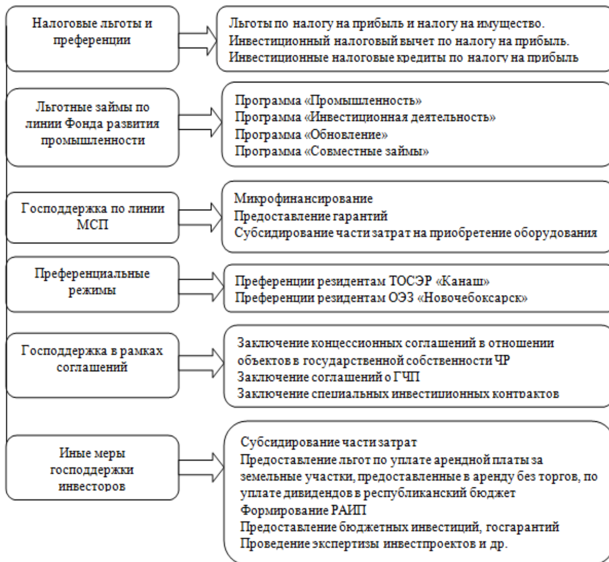
Рис. 2. Действующая система мер и форм государственной поддержки инвесторов в Чувашской Республике [сост. автором]

В Чувашской Республике проработана система форм и мер господдержки инвестиционной деятельности (рис. 2).