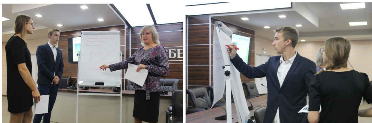
Рис. 3. Тренинг «Управление эмоциями как основа ориентированного на клиента сервиса»

В рамках инновационной модели образования студентов банковского дела с применением рабочих мест учебного полигона предусмотрена стажировка для будущих операционно-кассовых работников. Обучающий курс длится чуть меньше месяца, и уже после успешной сдачи экзаменов подготовленный специалист направляется на работу в филиал банка.