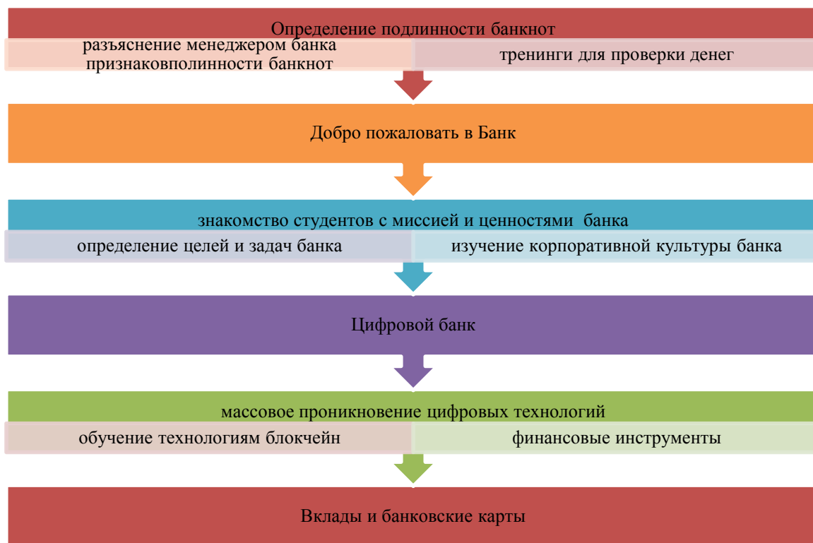
Рис. 1. Основные виды тренингов на учебном полигоне ПАО «Сбербанк» для студентов ОГБПУ «Рязанский технологический колледж»

Курс учебного полигона включает в себя следующие тренинги (рис. 1).