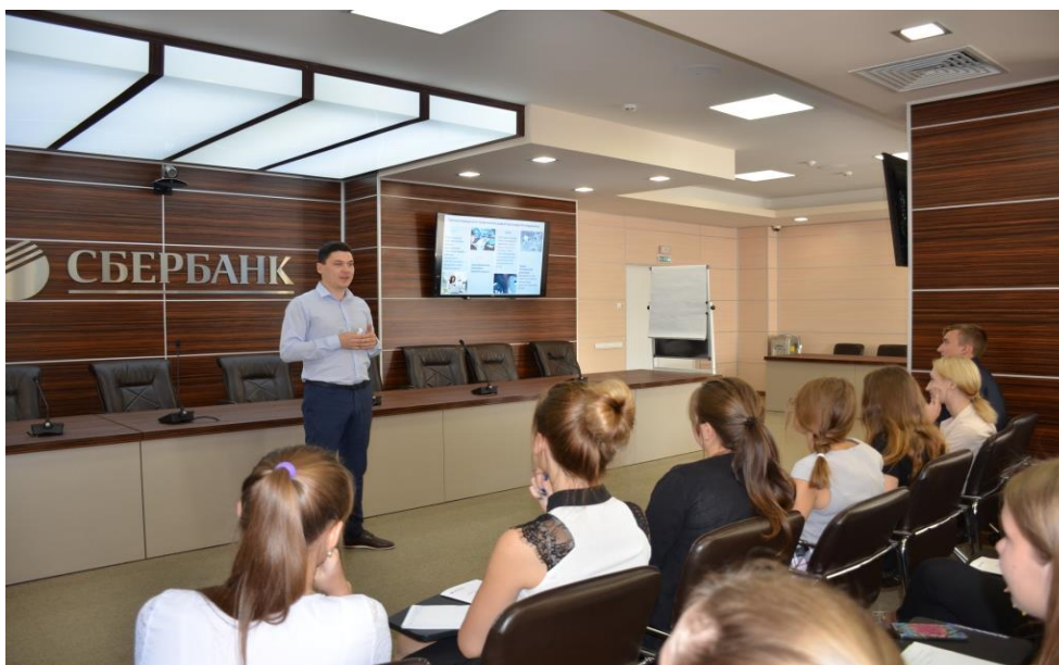
Рис. 2. Тренинг «Эпоха Digital – цифровой Банк»