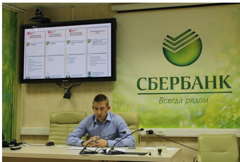
Рис. 4. Тренинг «Биржевые инвестиции и индивидуальный инвестиционный счёт»