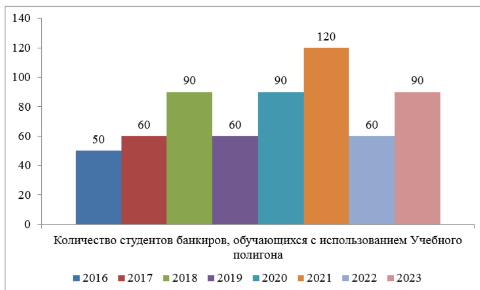
Рис. 7. Динамика числа обучающихся на площадке учебного полигона ПАО «Сбербанк» по специальности 38.02.05 «Банковское дело» за 2016–2023 гг., чел.

Рост числа студентов, сдавших итоговый зачет по дисциплинам специальности 38.02.05 «Банковское дело» на «хорошо» и «отлично», за 8 лет произошел на 20%. Данная динамика характеризует повышение качества образовательного процесса и отражает состояние улучшения готовности выпускников выполнять задачи работодателя.