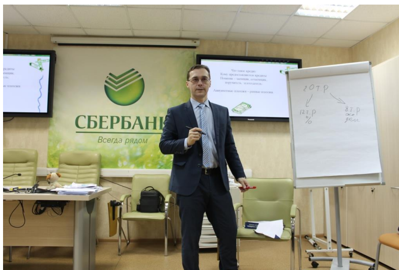
Рис. 6. Тренинг «Жилищные программы»

Программа учебного полигона может быть примером эффективной системы объединения потенциала образовательной организации СПО и работодателя в деле подготовки высококвалифицированных кадров.