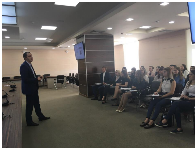
Рис. 5. Тренинг «Персональное обслуживание»

Таким образом, успешно пройдя все тренинги учебного полигона, студенты имеют полное представление о банке и спектре предлагаемых им услуг, а также о порядке трудоустройства в нём (рис. 6).