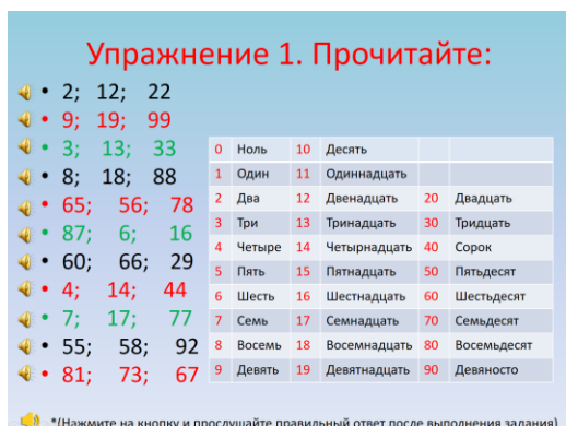
Рис. 2 Общий вид окна «Математика»

ции и практические/лабораторные работы сопровождаются аудио- или видео информацией, перекрестными гиперссылками, справочным и тестовым материалом (рис. 2, 3).