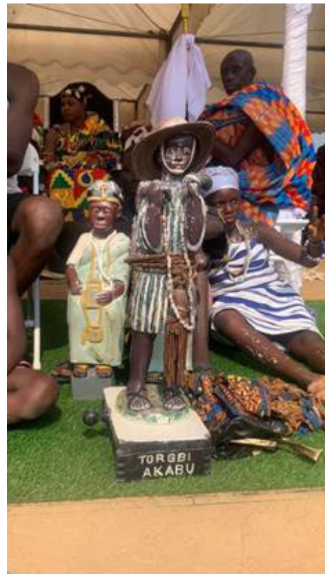
Рис. 5. Статуя покровителя племени – предка, представляет сообщество на фестивале Афенорто в Менне, Гана, 2024. Fig. 5. Statue of the patron saint of the tribe, the ancestor, representing the community at the Afenorto festival in Meppe, Ghana, 2024.

Тем не менее в рамках церемоний встречается и обращение к другим божествам пантеона в зависимости от целей ритуала, так как святилище – это дом для всех водун и трово. Также считается, что любое божество пантеона может войти в человека в рамках транса. Когда адепт культа находится в трансе, верховный жрец считывает символическую информацию с его поведения, на основании которой им создаются определенные пророчества. Важную роль выполняют также различные формы гадания. Задачи верховного жреца и его помощников не ограничиваются проведением ритуальных мероприятий. Они также осуществляют повседневную ритуальную деятельность, реализуют ежедневные подношения, а также проводят ритуалы для отдельных членов сообщества, отвечая на их просьбы и принимая подношения. Жрецы также создают фетиши и амулеты для просителей (рис. 6).