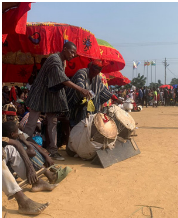
Рис. 7. Барабанички клана на фестивале Афенорто в Менне, Гана, 2024. Fig. 7. Clan drummers at the Afenorto festival in Meppe, Ghana, 2024.

Обязательным атрибутом любой ритуальной практики является музыка, представленная в основном игрой на барабанах (отдельным направлениям гороводу соответствуют разные типы барабанов) и погремушках, а также песнями – своими для каждого повода (рис. 7).