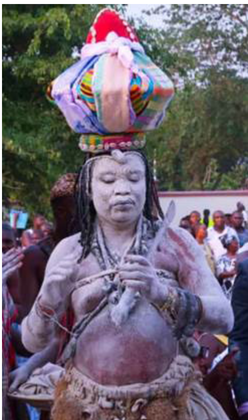
Рис. 6. Жрец культа водун в праздничной короне. 2020 г. Fig. 6. A Vodun priest wearing a festive crown. 2020.

Отправление культа 45 . Отправление культа гороводу / Кунде имеет множество форм и достойно описания в отдельной работе. Характеризуя отправление культа тезисно, следует отметить, что формы ритуалов типичны для религиозной системы водун и на уровне городского / деревенского святилища включают свадьбы, похороны, обряды инициации мужчин и женщин, а также религиозные праздники в честь конкретных божеств (как систематические, например, посвященный урожаю, так и ситуативные, например, призыв дождя в засуху). Кроме того, есть большое количество частных ритуалов, посвященных лечению, поиску ведьмы / колдуна, созданию личного или семейного фетиша, амулета, талисмана и т. д. Отметим, что отдельные ритуалы также проводятся в клановых и домашних святилищах, где жрецом выступает глава домохозяйства или клана. На уровне племени верховным жрецом выступает вождь (король).