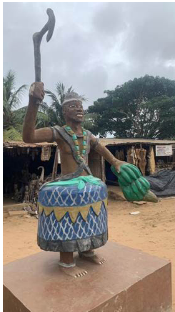
Рис. 4. Бог грома Хавьесо (культ гороводу).

Пантеон гороводу. Культ гороводу / Кунде строится вокруг пантеона, основанного на пантеоне водун. В традиции эве выделяются следующие божества: Маву – создатель, бог / богиня луны; Лиза (муж / брат / аватар богини / бога луны Маву – бог солнца / дня); Хевьесо (гром) (рис. 4); Агбуи (вода); Водун Да (змеиная радуга (Великий Питон)); Ахолу / Сакпата (земля); Эгу (железо); Анана / Нана Блуку (Булаку) (плодородие); Тогбуи Ньигбле (священный лес).