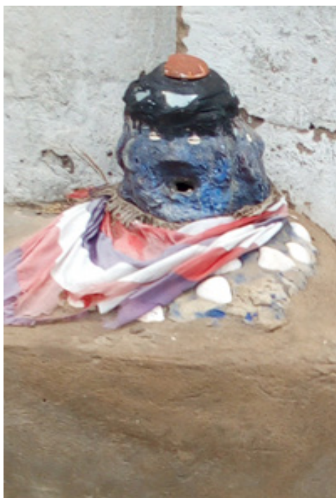
Рис. 1. Статуя (фетиш) божества Легба (хранителя порогов) – домашнее святилище. Кета, Гана, 2024.