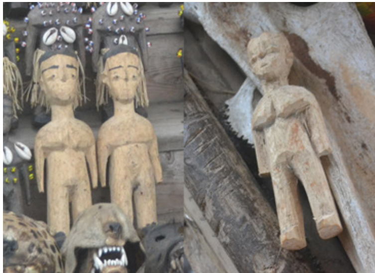
Рис. 3. Куклы венави, изображающие детей. Культ венави (близнецов). Того, 2024. Fig. 3. Wenavi dolls depicting children. The cult of Wenavi (twins). Togo, 2024.

на основании их мобилизационной социальной функции, востребованной в условиях, когда традиционная религиозная система и социальный порядок не в силах справиться с возникшими вызовами, угрожающими социальной безопасности. Данные культы являются массовыми, аффективными и иррациональными по своей природе. Часто ведущую роль в них играет мистицизм и вера в колдовство, а также конкретные духовные лидеры. Лидеры данных культов создают комплексную иллюзию избавления общества от угроз за счет радикальных практик, часто связанных с насилием, которое легитимизируется культом либо иными радикальными мерами, например, общей миграцией сообщества. При этом, несмотря на доминирование акцента ситуативных решений, данные культы преимущественно строятся на базе комплексной метафизической концепции, часто заимствованной у традиционной религии, и предлагают позитивное видение будущего без существующих угроз. Ю. Е. Березкин в числе культов данного типа называл культ Мамы Чи индейцев гуайми на западе Панамы, современные верования индейцев