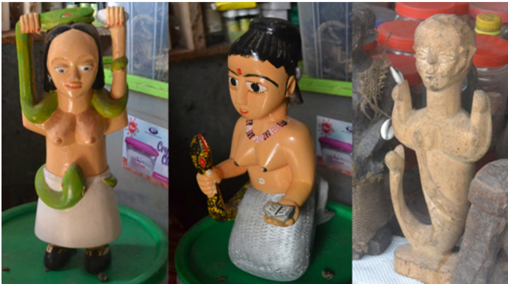
Рис. 2. Образы фетишей Мами Уотер. Гана, 2024. Fig. 2. Fetish images of Mami Water. Ghana, 2024.