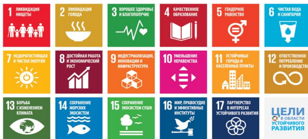
Рис. 2. Система целей в области устойчивого развития ООН

При этом указанные выше ESG-факторы сочетаются с целями устойчивого развития ООН, графическая интерпретация которых представлена на рисунке 2.