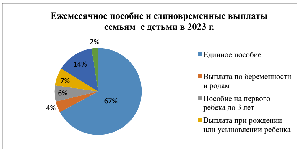
Рис. 2. Структура выплат ежемесячного пособия и единовременных выплат семьям с детьми в 2023 г.

Многодетные семьи (три и более ребенка) – особая категория семей в нашей стране. В 2023 г. количество многодетных семей достигло 2,4 млн, в них воспитывается 7,7 млн детей. Для них существует расширенный круг специальных федеральных и региональных льгот.