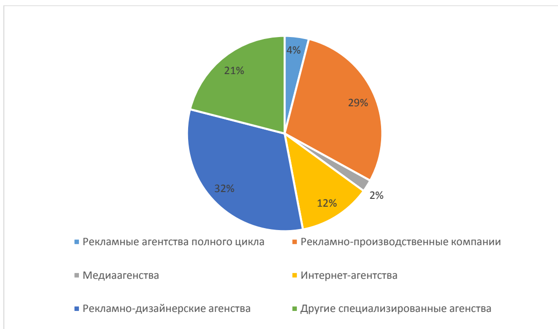
Рис. 2. Структура рекламных агентств по видам услуг

На калининградском рынке присутствуют агентства, специализирующиеся на digital-маркетинге, агентства по брендингу, прямому маркетингу, медиаагентства, агентства по исследованию рынка и другие (рисунок 2).