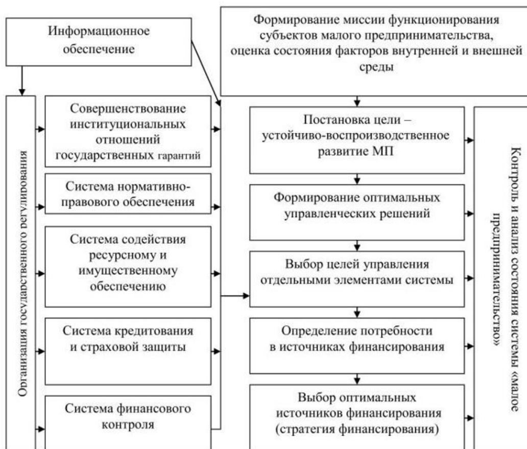
Рис. 4. Модель государственного регулирования развития малого предпринимательства регионе

Модель государственного регулирования развития малого бизнеса в регионе необходима для создания благоприятной среды для развития социального предпринимательства. Это достигается путем предоставления финансовой помощи, налоговых льгот, упрощения процедур регистрации. Модель направлена на создание структурной взаимосвязи крупного, среднего и малого бизнеса, формирование современной структуры рынка труда и активной конкурентной среды.