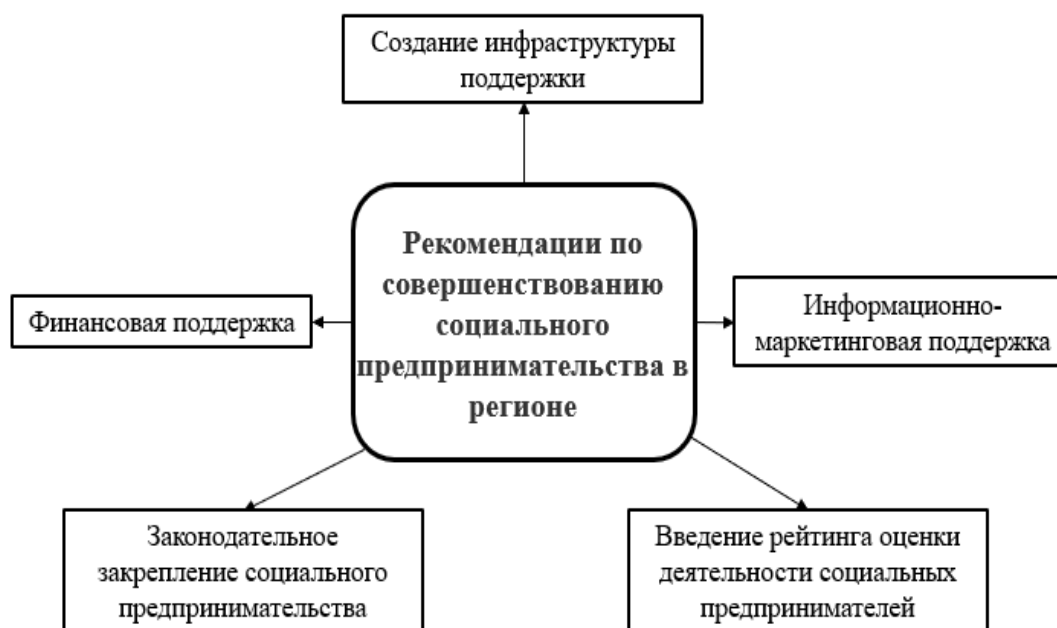
Рис. 3. Рекомендации по совершенствованию социального предпринимательства в регионе

Для становления и развития социального предпринимательства в регионе рекомендуется следующее: разработка и закрепление в региональном законодательстве системы мер поддержки социальных предпринимателей. Это могут быть финансовые (гранты, субсидии, налоговые льготы) и нефинансовые меры (образовательные, информационные, консультационные).