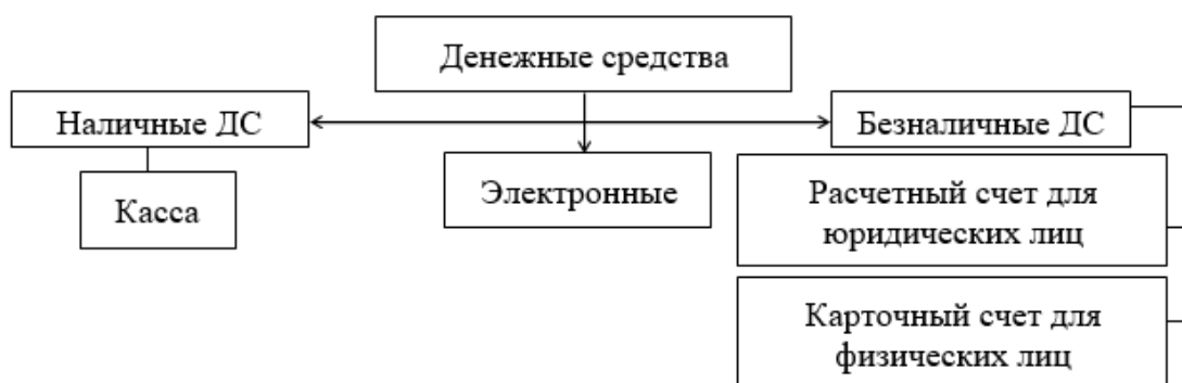
Рис. 2. Классификация денежных средств

Далее перейдем к рассмотрению классификации денежных средств (рис. 2).