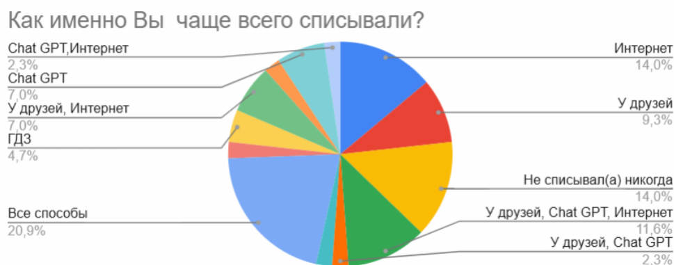
Рис. 2. Опрос студентов 2 курса

Рассматривая методы списывания (рис. 1, 2) можно сказать, что наиболее часто студенты ищут ответы в интернете (59,4% – 1 курс и 55,8% – 2 курс). Второе место по полярности уверенно занимают друзья, практически не меняя значения в зависимости от года обучения (51,3% – 1 курс и 51,1% – 2 курс). Chat GPT занимает третье место (48,6% – 1 курс и 44,1% – 2 курс), а ГДЗ постепенно теряет актуальность в СПО (32,4% – 1 курс и 25,6% – 2 курс), ввиду отсутствия единых методических комплектов и многообразия специальностей.