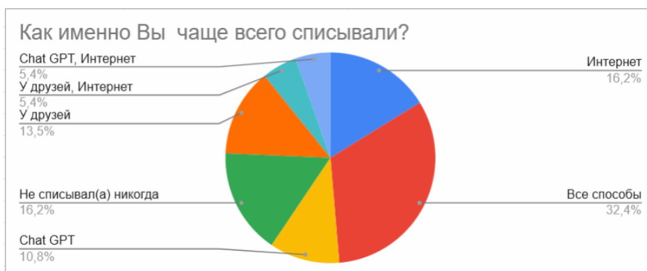
Рис. 1. Опрос студентов 1 курса

Из результатов спроса известно, что количество списывающих студентов 1 курса немного меньше (81%), чем студентов 2 курса (86%). По частоте списывания студенты 1 и 2 курса практически не отличаются. Ответы редко (35,1% – 1 курс и 41,9% – 2 курс) и никогда (13,5% – 1 курс и 9,3% – 2 курс) составляют практически 50% от общего количества, что говорит о том, что около половины студентов часто прибегают к списыванию.