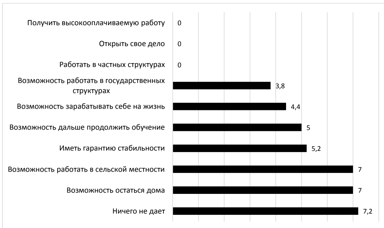
Рис. 1. Ответы студентов основной группы на вопрос: «Что дает Вам диплом?» (баллы)

Опираясь на выявленный факт, можно предположить, что многие студенты основной группы не стремятся что-то изменить в своей жизни, «плывут по течению», с одной стороны, а с другой – что для некоторых из них важным все-таки является приверженность семейным традициям и близкие связи с родственниками и семьей, любовь к малой родине и желание жить и работать там, где родился.