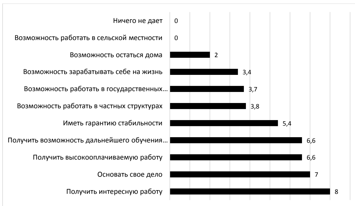
Рис. 2. Ответы студентов второй группы на вопрос: «Что дает Вам диплом?» (баллы)

Здесь большинство студентов считают, что получение диплома дает им возможность получить интересную работу (8,0), основать свое дело (7,0) и получить высокооплачиваемую работу (6,6). Многие студенты второй исследовательской группы ориентированы на продолжение своего обучения в образовательных организациях высшего образования и считают, что получение диплома поможет им с поступлением и прохождением отборочных испытаний. Характерно, что в 0 баллов оценены такие варианты ответа на вопрос, как «Возможность работать в сельской местности» и «Ничего не дает».