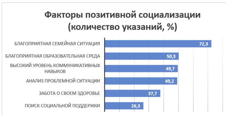
Рис. 10. Факторы позитивной социализации подростков (%)

При определении корреляций в возрастной группе 13–14 лет была выявлена умеренно значимая отрицательная связь между копинг-стратегиями «анализ проблемы» и «избегание» ( -0,448 ; p < 0,001 ); копинг-стратегиями «анализ проблемы» и «эмоциональная разрядка в форме агрессии» ( -0,491 ; p < 0,001 ); копинг-стратегиями «анализ проблемы» и «поиск социальной поддержки» ( -0,453 ; p < 0,001 ). В возрастных группах 15–16 и 17–18 лет последняя взаимосвязь становится значимо положительной: 0,484 ; p < 0,001 и 0,436 ; p < 0,001 соответственно.