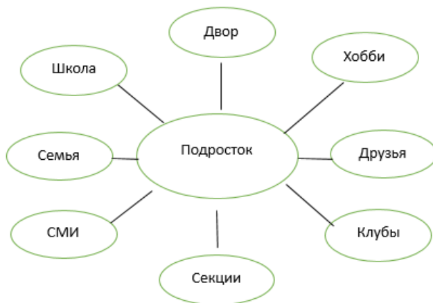
Рис. 1. Социальная ситуация нормального развития подростка

В рамках работы с проблемой отклоняющегося поведения специалистами центра «Перекресток» Московского государственного психолого-педагогического университета была предложена схема социальной ситуации развития нормального подростка [46]. Схема представлена на рисунке 1.