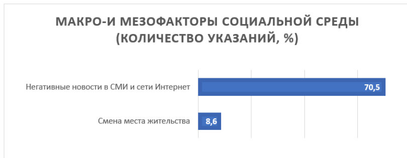
Рис. 6. Социальные макро- и мезофакторы риска негативной социализации (%)

• Смена места жительства. О переживаниях из-за того, что пришлось переехать в другой район/город/регион, говорит 8,6% подростков. В подгруппе респондентов 17–18 лет, обучающихся в вузе, данный показатель значительно выше и составляет 17,4%. Это связано со сменой города проживания в связи с поступлением в образовательное учреждение высшего образования.