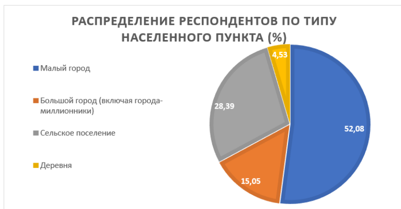
Рис. 4. Распределение респондентов по типу населенного пункта (%)

Большинство респондентов проживают в малых городах – 52,08% (9406 чел.). В сельском поселении – 28,39% (5127 чел.). В больших городах (включая города-миллионники) проживает 15,05% участников (2719 чел.); в деревне – 4,53% (818 чел.) (рис. 4).