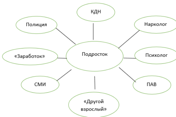
Рис. 2. Новая социальная ситуация подростка

В целом все это приводит к школьной дезадаптации и негативной социализации подростка. Постепенно социальная ситуация развития подростка приобретает иной вид (рис. 2).