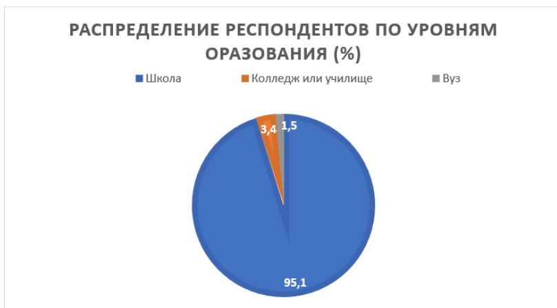
Рис. 5. Распределение респондентов по уровням образования (%)

В возрастной группе 17–18 лет учащимися школ являются 73,3% (1860 чел.), в образовательных организациях среднего профессионального образования обучаются 16,29% респондентов (413 чел.), в образовательных организациях высшего образования – 10,4% (263 чел.)