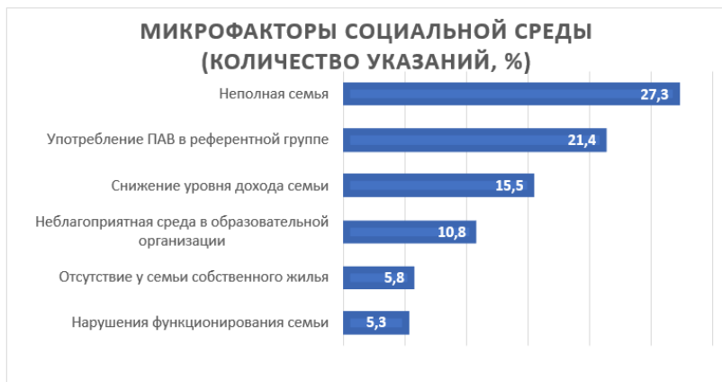
Рис. 7. Социальные микрофакторы риска негативной социализации (%)