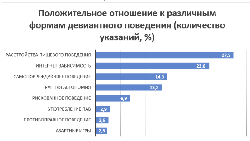
Рис. 9. Положительное отношение подростков к различным формам девиантного поведения (%)

• Немногие подростки считают нормой употребление психоактивных средств и зависимость от азартных игр (2,9% и 2,3% респондентов соответственно).