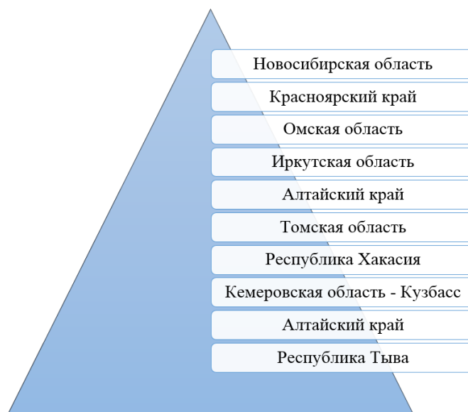
Рис. 2. Рейтинг регионов СФО по инвестиционной привлекательности

Динамика инвестиционной привлекательности регионов является разноплановой на фоне турбулентности в добывающих отраслях и перестройки логистических потоков. В Алтайском крае и Республика Тыва меры по привлечению инвестиций в данный период не имеют никакой результативности.