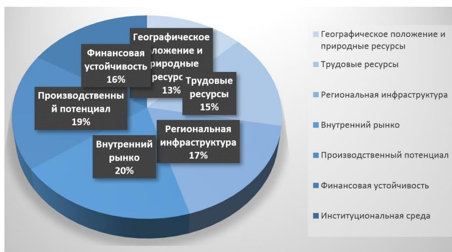
Рис. 3. Факторы региональной инвестиционной привлекательности

Динамика инвестиционной привлекательности регионов является разноплановой на фоне турбулентности в добывающих отраслях и перестройки логистических потоков. В Алтайском крае и Республика Тыва меры по привлечению инвестиций в данный период не имеют никакой результативности.