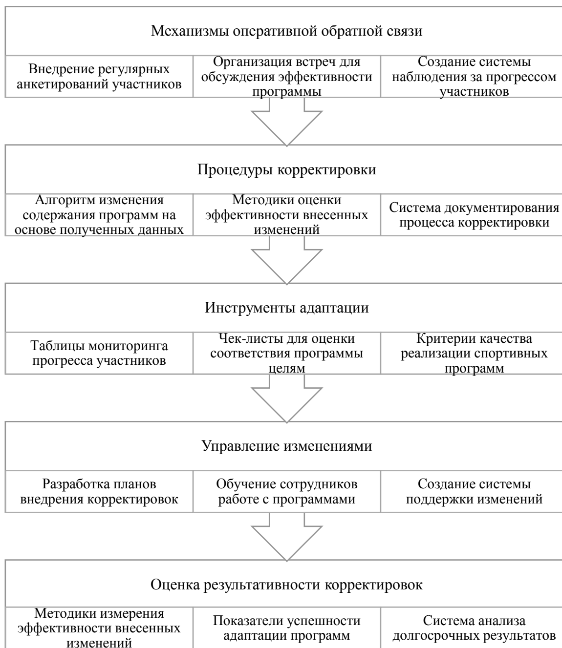
Рис. 4. Алгоритм гибкой система корректировки спортивных программ.

Кроме того, должна быть создана гибкая система корректировки спортивных программ. Алгоритм приведен на рисунке 4.