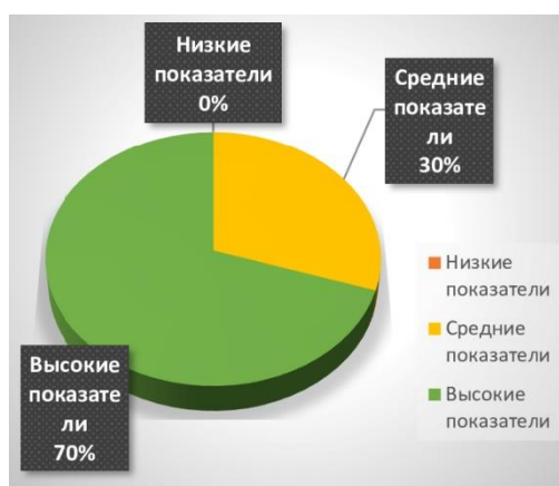
Рис. 4. Результаты по шкале «Зеркальное Я» методики исследования самоотношения С.Р. Пантеева

Молодые люди, находящиеся на попечительстве, считают принятыми себя окружающими людьми в полной мере (14 человек, 70%). По их словам и ощущениям окружающие люди ценят их за личностные качества, за совершаемые ими действия и поступки, за готовность следовать правилам и нормам культурного поведения и проявление легкости в установлении взаимоотношений с другими людьми (рис. 4).