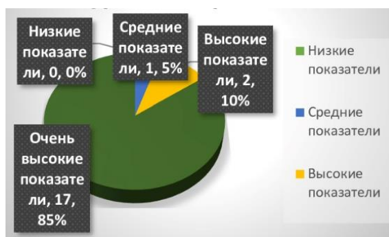
Рис. 2. Результаты исследования уровня притязаний по методике Дембо-Рубинштейн

был только у 2 участников (10%). Только у одного молодого человека (5%) наблюдался средний уровень самооценки (рис. 2).