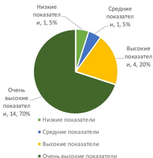
Рис. 1. Результаты исследования уровня самооценки по методике Дембо-Рубинштейн

У молодых людей с интеллектуальными и комплексными нарушениями (14 участников, 70%) наблюдались очень высокие показатели уровня самооценки, которые акцентируют внимание на человеке личностно незрелого, не умеющего правильно оценивать результаты своей деятельности. У остальных молодых людей были оптимальные показатели (4 участника, 20%), средние показатели (1, 5%) и низкие показатели (1, 5%) (рис. 1).