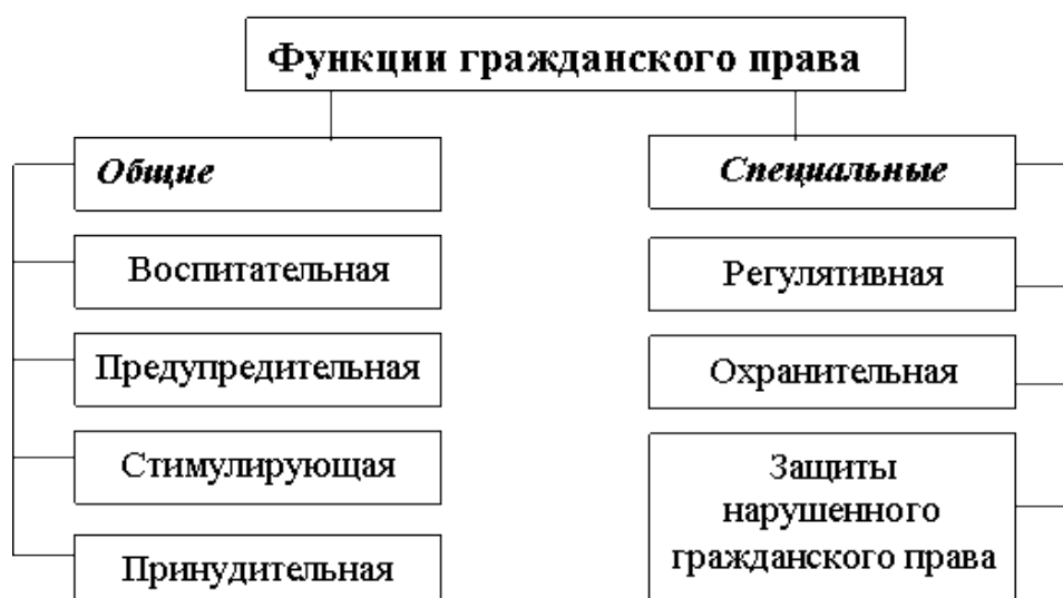
Рис. 1. Функции права

На рис. 1 представлены функции гражданского права, которые обеспечивает государство с целью регулирования правовых отношений.