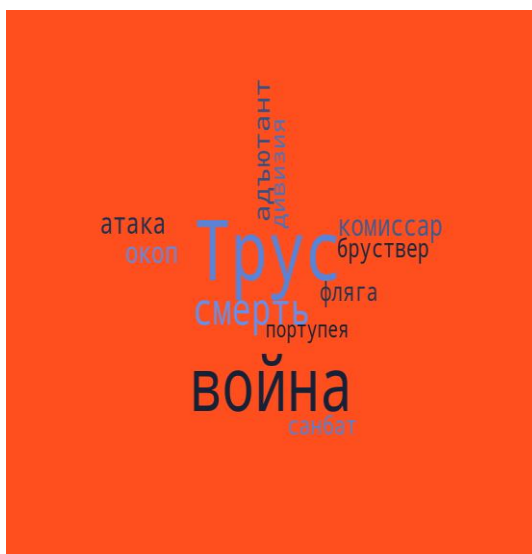
Рис. 1. Облако слов, созданное с помощью программы

2. Найдите в толковом словаре значения новых слов, составьте с ними словосочетания: